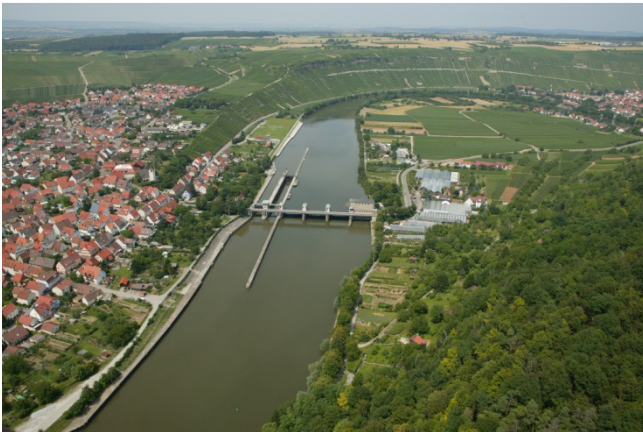
Staustufe Hessenheim aus der Luft