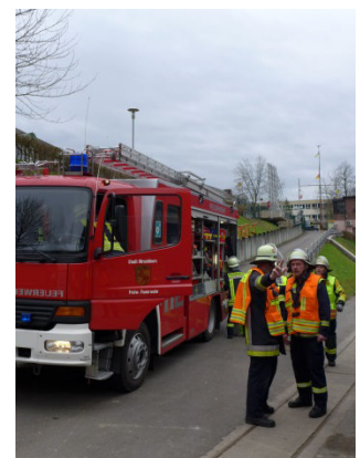
Einsatzbesprechung der Freiwilligen Feuerwehr Hirschhorn